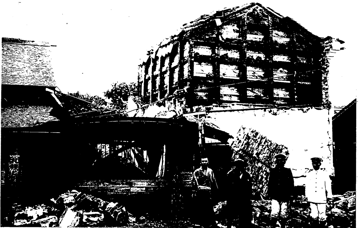
ルゼ生ニ爲ノ震地日兩五廿四廿月七年三十四治明 圖四十二第 害震ノ街市田蛇