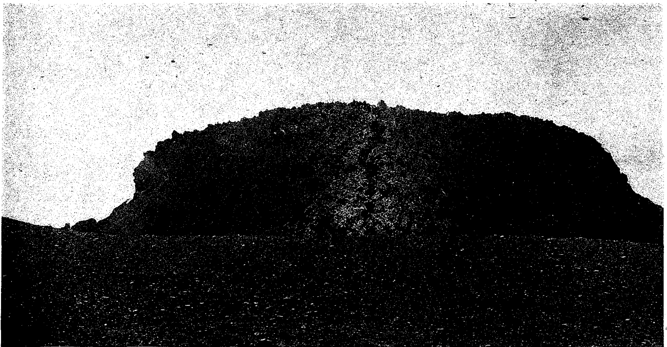
(影撮森大日九月六年六正大) ム望リヨ近附點角三東ヲ面北々東ノ丘岩鎔 圖六十二第

中央ノ割レ目ハ大正六年五月十二日噴火ノトキ生ゼル大裂 罅ニシテ兩側ニ灰ヲ積モラセタリ下端ニ井狀ノ深孔アリ