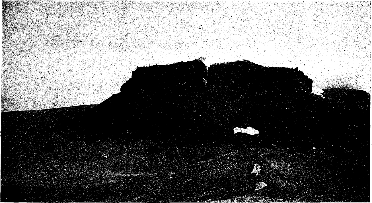
(影撮森大日七月六年六正大) ム望リヨ點角三西ヲ面西南丘岩鎔 圖五十二第

右側ノ白煙ハ大正六年四月三十日ニ爆發セル硫氣孔ニシテ頂上 中央ノ割レ目ハ同年五月十二日噴火ノ大裂罅ノ西端ナリ