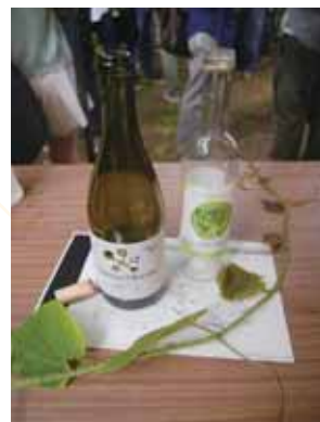
■ 当日振る舞われた酒造会社寄付のワインと、その寄付の縁をとりもったトゲブドウの枝

今回も、企画・準備・後片付けに各学科から選出された学部生が活躍した。他学部にはない、理学部独自の伝統行事で、学科の垣根をこえた交流ができるだいな場としての交歓会を今後も続けていってほしい。