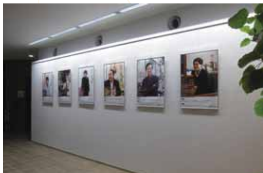
■ 本部棟ロビーでのポスター展示のようす

歴史的な展示と共に、ポスター展示では現役で活躍する最先端の研究者および卒業生を紹介している。卒業生2名、現任教員4名のにこやかな笑顔は、通る人に理学部の魅力を大いに伝えたと確信している。