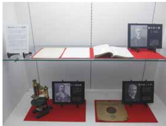
■ 明治から大正にかけて理学部で活躍した教員のゆかりの品