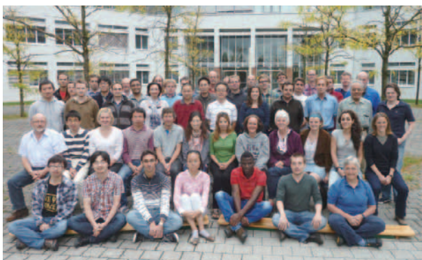
国際色豊かな顔ぶれが集うBGIメンバー（筆者は前2列目中央）

2013年7月から、1年の長期滞在を予定している。バイエルン州の豊かな自然に囲まれたBGIで、カッコいい女性研究者を目指してまた頑張りたいと決意を新たに、再渡独を今は心待ちにしている。