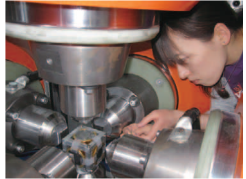
6軸プレスを使った実験の準備

BGIは国際的な研究拠点で、多彩な国籍のスタッフ陣から成る。所内は英語が公用語とされ、それゆえに、独語も英語も母国語としない研究者が世界中から集う。国を越えた同世代の仲間から刺激を受け合い、ユーモアあふれる彼らとの交流に元気づけられた。滞当初、研究者と技術者の分業分担の制度に驚いた。日本のように研究者が一からすべてをやることに良さがあるが、あるレベル以上は専門家に任せるというスタンスに、効率よく研究成果を上げる秘訣と感じた。また、BGIの女性比率が高いことも驚きだった。（男性よりも）エネルギーギッシュで、はつらつと働く女性研究者の姿に感銘を受けた。このようにドイツに居ながら、日本と世界各国との文化や境遇の違いを所々で垣間見た。 プライベートでは、コンサートに出かけ、郊外のサイクリング