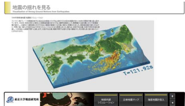
図 7. 地震動のシミュレーション動画