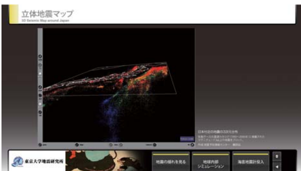
図 8. 画面を指で触ることにより直感的操作が可能な立体震源マップ（日本域）