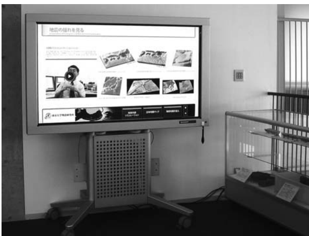
図 1. 地震研究所 1 号館 2 階ラウンジに設置された対話型リッチコンテンツ表示システム (65 インチ型)。幅は 157 cm。

対話型リッチコンテンツ表示システムは、学会ブースや地震研究所への来訪者に対し、担当者が身振り手振りを交えながら、研究所概要や研究成果の説明を行うためのプラットフォームと位置付けた。将来的には、地震研究所の様々な研究成果を可視化して収納し、相手に応じた適切なコンテンツを自由自在に表示することを目指している。初期コンテンツとしては連合大会のブース展示を意識し、理学・工学に関心を持つ高校生・大学生に対して固体地球科学等の魅力を伝えることを目的とした。