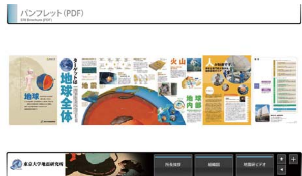
図 5. 拡大表示可能なパンフレット