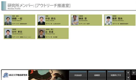
図 6. 教員紹介の例（氏名，専門分野，顔写真）