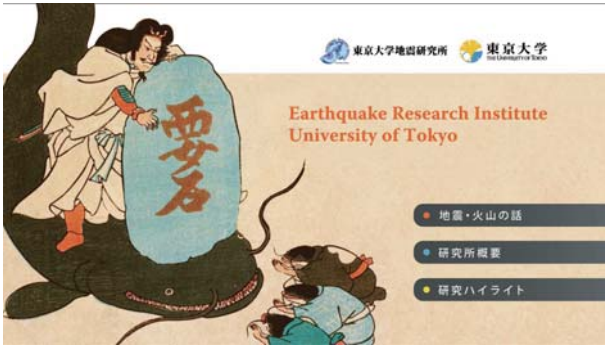
図 2. トップメニュー（解像度は1920×1080ピクセル）