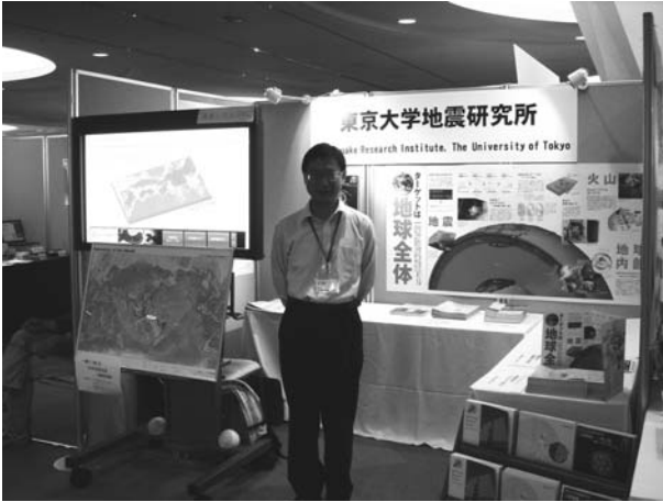
図 9. 連合大会に出展した地震研究所ブース

だが、用意したパンフレット(400部)、世界震源地図(200枚)等は会期前半に品切れとなっており、少なくとも400名の来訪者があったと思われる。