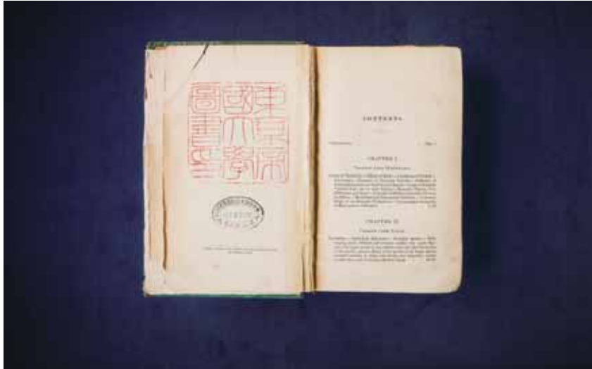
種の起源の表題紙裏。受入時の東京帝国大学蔵書印が押されている。