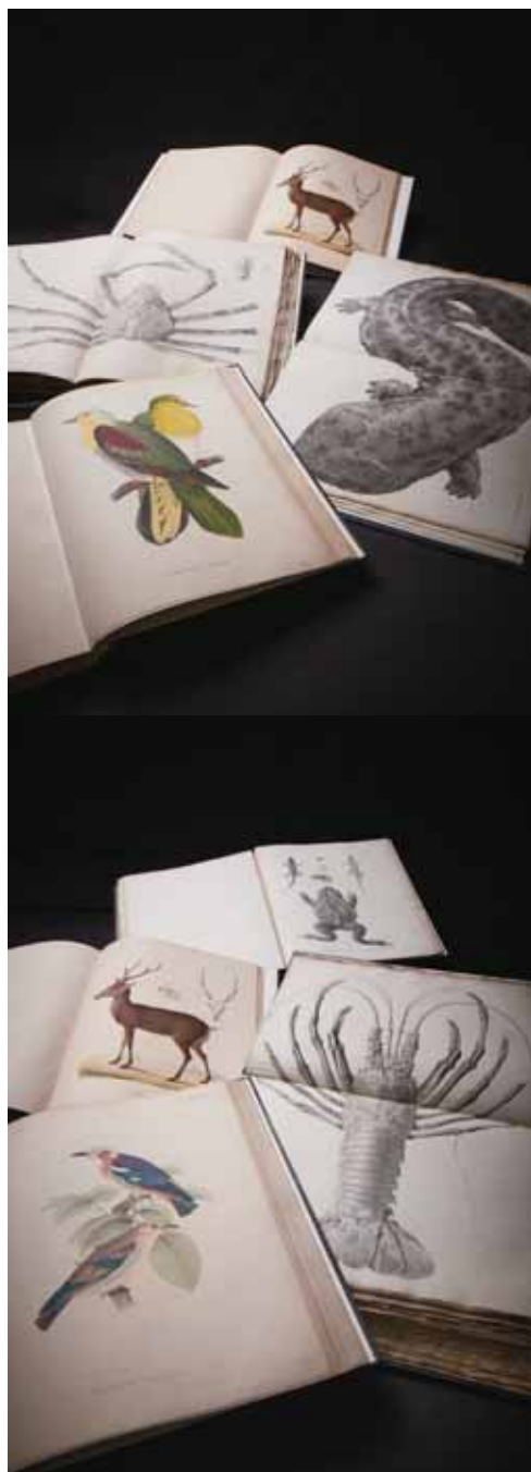
(左) 表題紙の背景には十二支などが描かれている (上) 多種多様な動物たち。上から4番目のアオバトはシーボルトにちなんで学名を付けられた

※本稿の作成にあたり、総合研究博物館研究事業協力者井手陽一氏（海洋プランニング株）にコメントをいただいた。