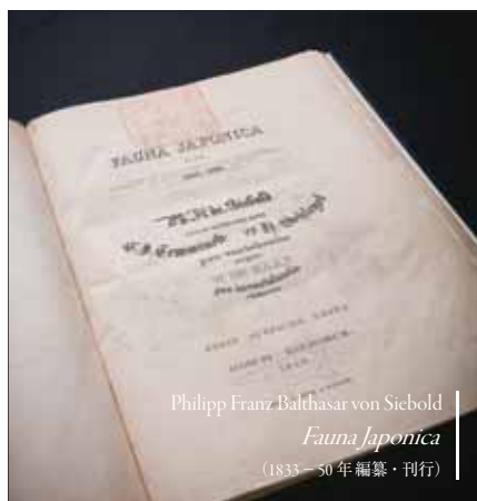
Philipp Franz Balthasar von Siebold Fauna Japonica (1833-50年編纂・刊行)

分子系統学的手法によって、従来の生物分類は変革を迫られている。しかし遺伝子にばかり目を奪われ、木を見て森を見ずになってはいないだろうか。形態の違いに着目して、分類し名前をつけるという、本来の科学者の動機に寄り添った情熱に接することは、すべての研究者にとって初心に戻る一助となるだろう。