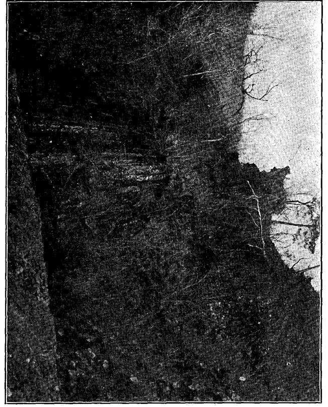
第三圖 大倉川上流定義ノ材木岩、玄武岩質アズシテ柱狀節理著シ。