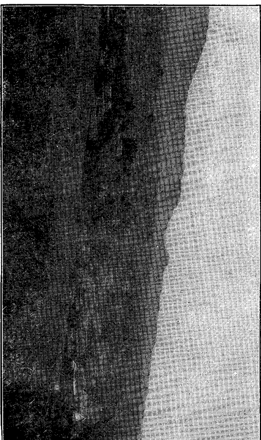
五ハルヌ居蟻ク高ニ方左、ム望ヲ岳原家五リヨ地高方北ノ町早諫 圖一第 、リナ流岩ソゾニア石輝蘇紫ノ山江小ハスナラ狀子卓ニ右其ヲシニ岳原家 キ引ヲ野禰ニ東ヲシニ(岩ソゾニア石輝蘇紫)山岩高ハルセナラ嶺小ニ東其 泥塊ハ地平ノ面前ヲシニ地斜緩ノ岩泥塊ハ方後ノ落部、ル至ニ地ノ淺ク廣ク岩 。リナ谷溪支一ノ川明本ルテ穿ク廣ク岩