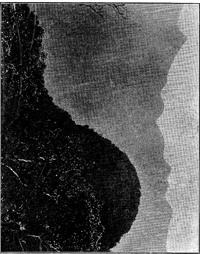
嶽ノ經ハルユ見ニ方後、ム望リヨ西ヲ峯主山甲鳥ヲリアニ中山甲鳥 圖三第 ○リナ峯連ノ岳ノソバサ