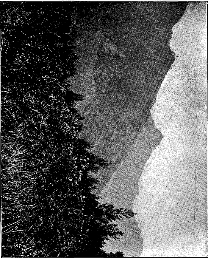
右テシニドツミラビ嶽ノ經ハ中央、ム望ヲ嶽ノ經ニ北東リヨ木黒 圖四第 ○リナ山ケカツカハ方左、リナ嶽ノソバサハク續ニ