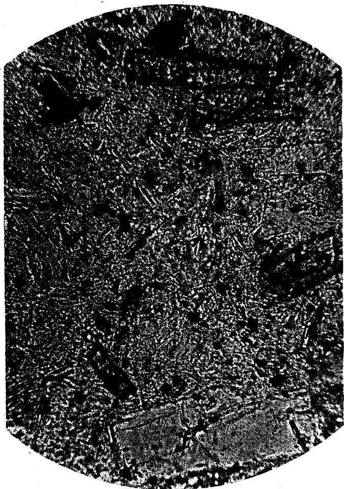
Fig.3.—Hypersthene Andesite × 205