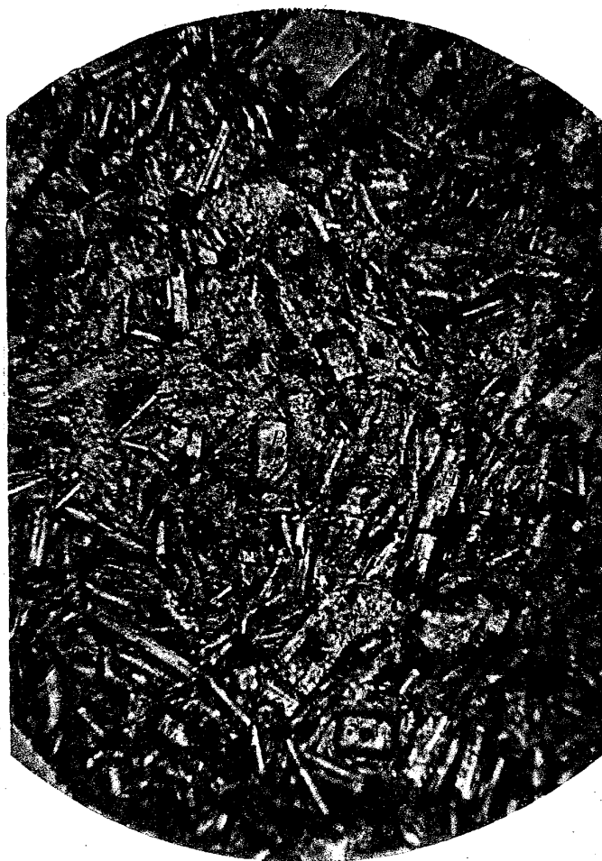
Fig 1.—Andesitic Basalt. × 205