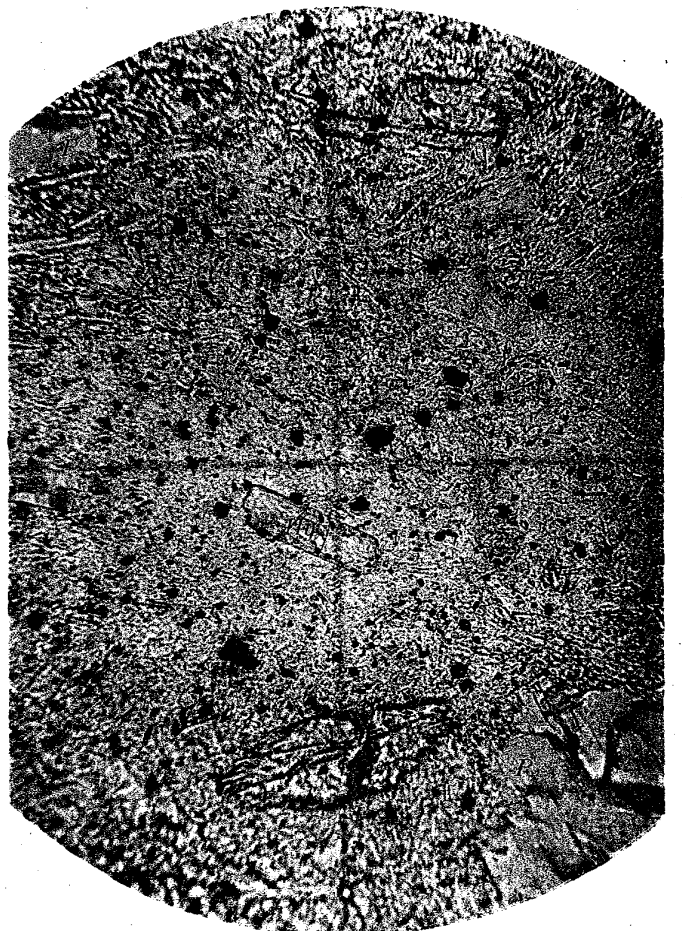
Fig.2.—Hornblende Andesite. \times 205