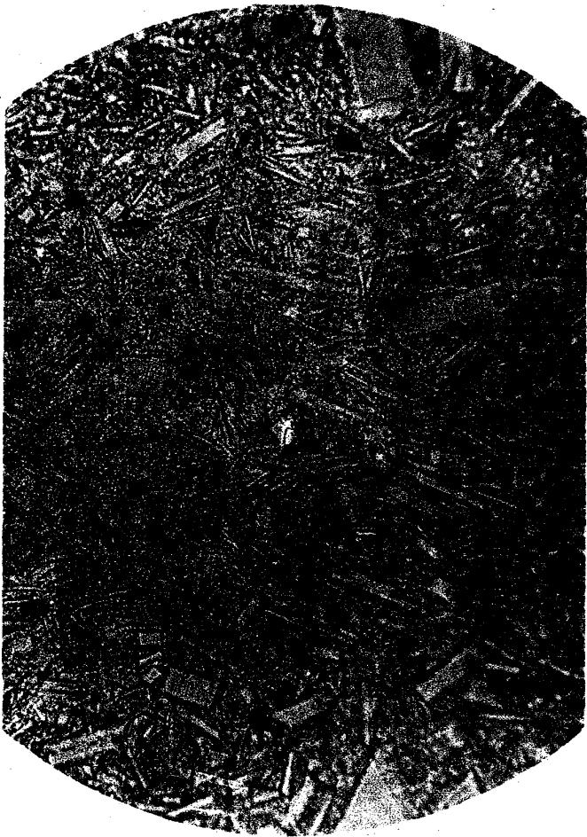
Fig.3.—Hornblende Andesite. \times 205