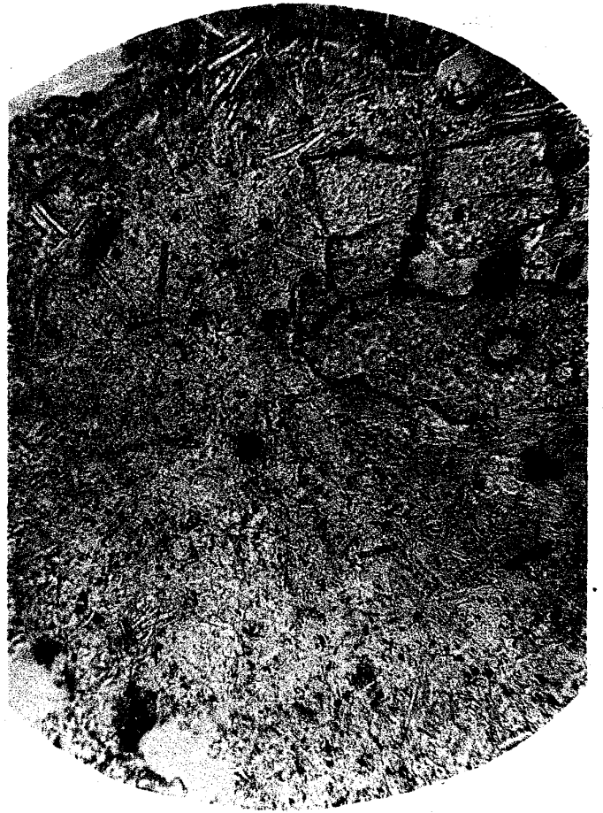
Fig.1.—Hornblende Andesite. \times 205