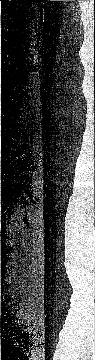
Fig. 2. View of the southeastern side of Unzen volcano and Myuryugama, seen from Cape of Futsu beyond the Bay of Fukayá.