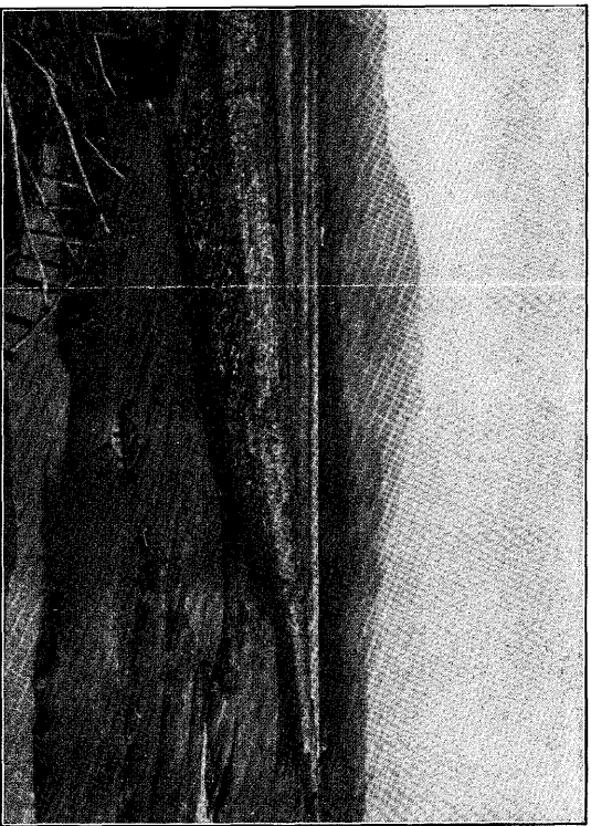
Fig. 2. The volcanoes seen from the north-west (from Yamada village).