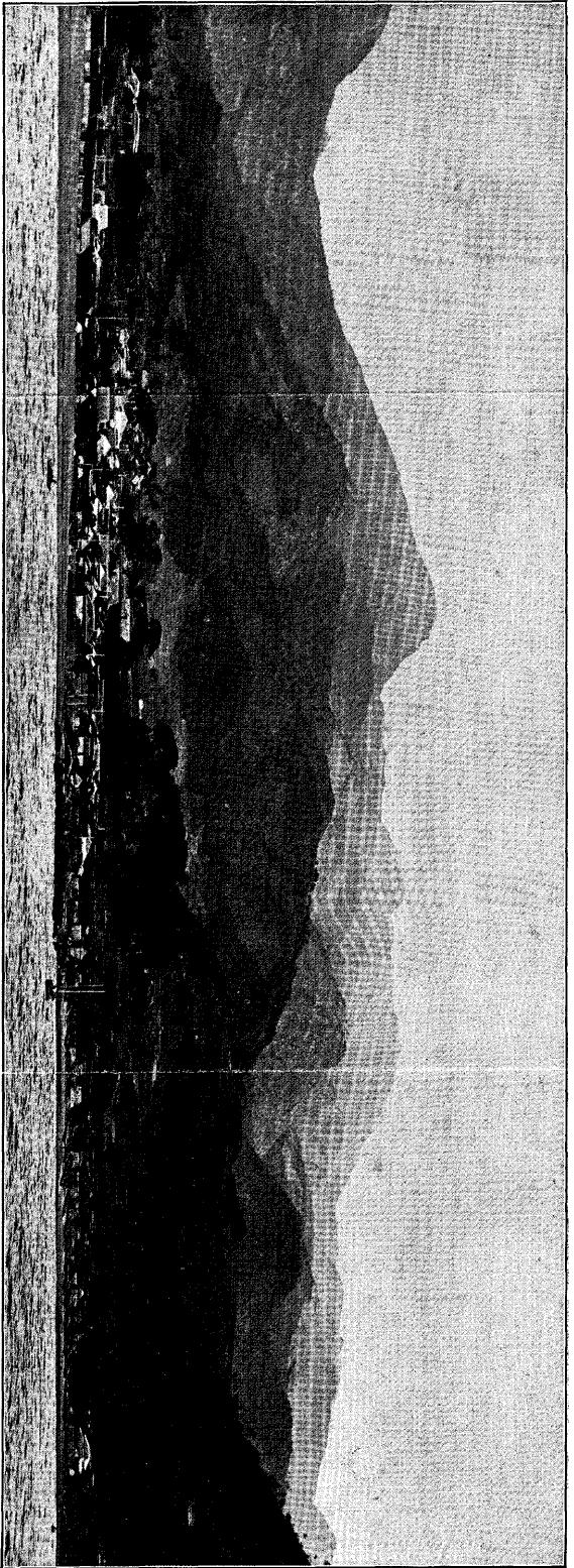
Fig. 1. The western panoramic view of the volcanoes seen eastwards from the Bay of Chifuwa.