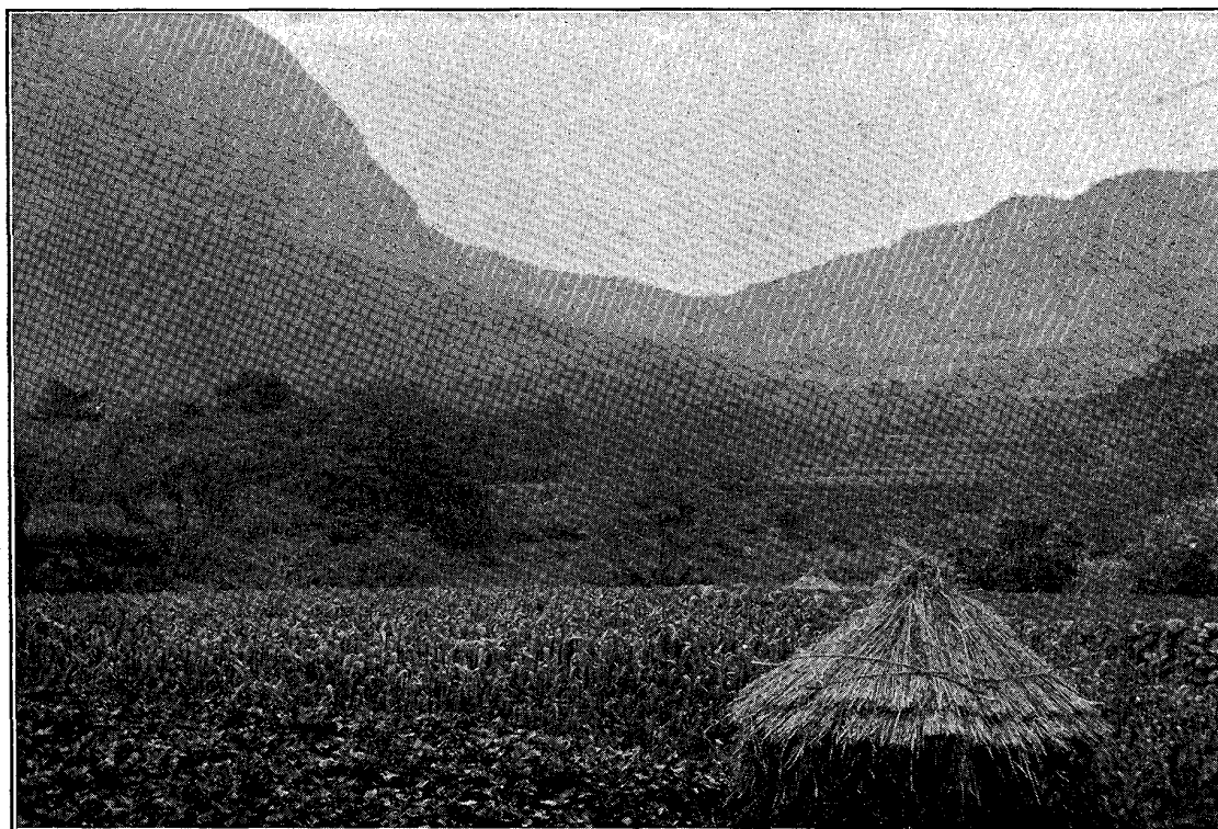
Fig. 1. An explosion crater on the back side of Mayu-yama, seen from the northwest.