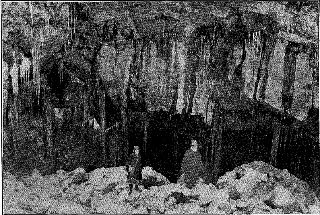
Fig. 1. The lava-tunnel, 'Hatono-ana (doves' cave)' of the Meireki lava stream near the eruption-crater of "Furu-yaké."