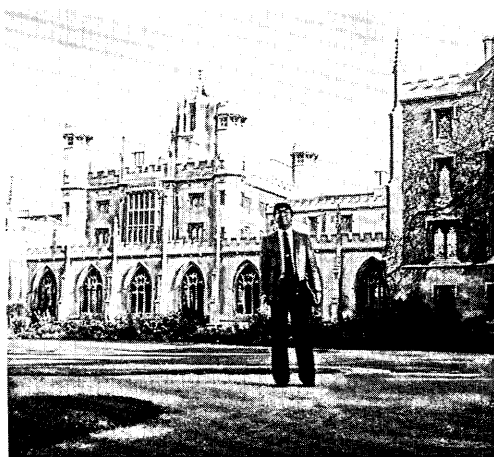
図1 ケンブリッジ大学 St. Jones Colledge の宿舎の前で

次元系特有の励起子状態、色の変化を伴う構造相転移現象、擬一次元系の非線形光学などで3日間にわたって活発な討論が行われた。ポリジアセチレンの色相転移のメカニズムに関しては、長年さまざまな議論がなされてきたが、固体高分解能NMR、赤外・ラマン分光による研究の結果、色の変化が次のような機構によっているという共通の認識が形成された。すなわち、色相転移は、側鎖のコンフォメーション変化により主鎖構造へ歪が生じ、その結果主鎖共役電子の非局在化の度合いが変化したことによる可能性が高い。また、今回、熱誘起色相転移のみならず、レーザー光照射によっても主鎖の電子構造の変化による色相転移を可逆的に起こすことが可能なことが示された。この事実は、光誘起相転移のメカニズムとダイナミクスという基礎的観点からばかりでなく、高速かつ高密度な記憶材料の新しい可能性を示すものとしても注目を集めた。また、 \pi 電子の擬一元的な広がりの大きさを利用した非線形光学材料の基礎となるデータとして、 \pi 電子の非局在化の度合いと非線形光学定数の関係、3次の非線形感受率の波長依存性等を示すデータが示された。これらは、今後の非線形光学材料の設計指針となるべき重要な基礎データである。擬一次元系のバンド構造・励起子準位、特に禁制準位の研究手段として、2光