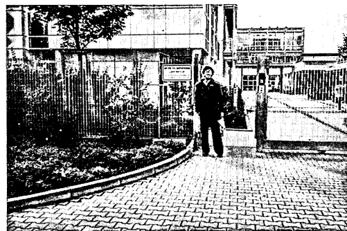
図3 マックス・プランク高分子研究所の前で

で行われていた機能性高分子に関する国際会議への参加とマックス・プランク高分子 (MPI) 研究所の訪問が主な目的であったが、私が感銘を受けたのは MPI の方であった。MPI は、330人の職員、30人の訪問研究員、90人の PhD コースの大学院生などからなり、規模は生研とさほど変わらないが、研究所全体が高分子物理・高分子化学の研究を指向している点で、研究所の性格は大きく異なっている。最も驚いたのは、この研究所には、教授が4人しかいない点で、ドイツにおける教授の地位の高さは、教授室を訪問するとその瞬間に体感できた。ただし、地位が高い分だけ責任も重いようで、マックス・プランク財団が研究業績を厳格に評価し、研究成果があがらないとその地位を追われるとのことであった。紹介してもらった研究はどれも第一戦級の独創的なものであったが、特に興味深かったのは、エーヴェン博士らの準弾性中性子散乱、特に中性子スピン・エコー法を用いた高分子のダイナミクス研究、クレマー博士らの非常に広周波数帯域 (1 mHz~10GHz) の誘電緩和とスペクトスコピーによる相転移現象の研究、ラーベ博士らによる STM による高分子鎖のコンフォメーション等の分子レベルでの動的な研究等であった。中性子スピン・エコー法は、最近注目を集めている古くて新しい問題の一つであるガラス転移点近傍のゆらぎのスローダイナミクスの研究な威力を発揮すると考えられ、ゲツェらのモード結合理論の実験的検証も含め大きな可能性を秘めた手法である。また、スピース教授の率いる NMR グループは、次々に新しい固体 NMR の手法を開発しており、2次元重水素 NMR による高分子のスローダイナミクスとその運動様式の直接決定、2次元固体 NMR を用いたガラス転移点近傍におけるエルゴディシティの実験的検証、外場変調を利用した2次元相関 NMR スペクトロスコーピーなど、どの研究も独創性豊かな世界最先端の研究であった。研究スタッフもみないきいきと研究をしており、彼らとの議論は非常に面白かった。彼らの研究に共通しているのは、アイデアの斬新さはもちろんであるが、装置がきわめてがっちりとして緻密に設計・製作され