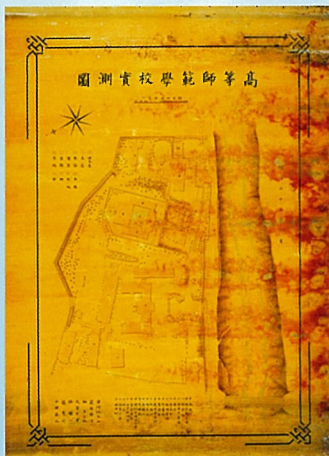
高等師範学校実測図 (明治27年4月) 生徒が測量して作成したもの。

なお、国内ではほかに第三高等学校、第四高等学校旧蔵のものが知られています（いずれも京都大学附属図書館のウェブサイトで見ることができます）。