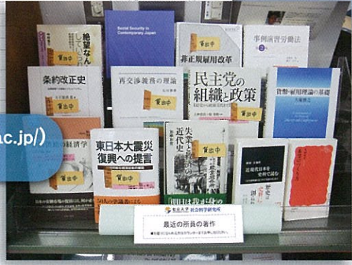
社会科学研究所図書室の教員著作コーナー

【お問い合わせ先】 各キャンパス図書館 (総合図書館・駒場図書館・柏図書館) および各部局図書館・室