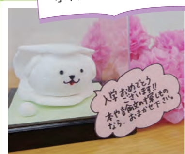
物性研のアイドル物性犬