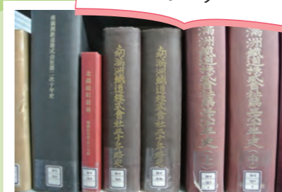
就活にも役立つ社史コーナー