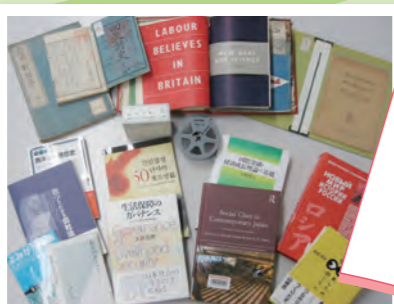
社研のさまざまな資料