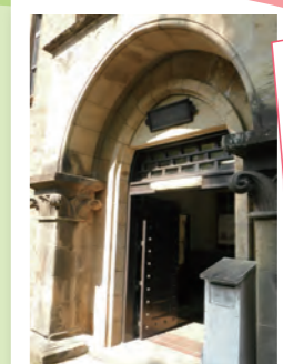
明治新聞雑誌文庫の クラシカルな玄関