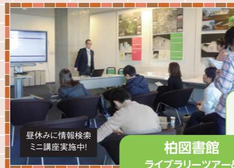
柏図書館 ライブラリーツアー& オンラインサービス講習会

URL: http://lib.c.u-tokyo.ac.jp/ 対象: 学内者(主に新入生) 駒場図書館(駒場キャンパス)文科・理科それぞれの初年次ゼミナールで学術情報の探し方を案内します。また、主に新入生を対象とした図書館ツアーや情報検索ガイダンスも行っています。東京大学の膨大な学術情報資源をフルに活用して、充実した学生生活を。開催日等の詳細は駒場図書館ホームページをご覧ください。