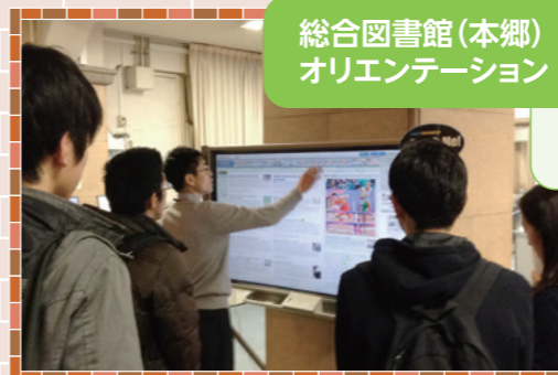
総合図書館(本郷) オリエンテーション

東京大学には、総合・駒場・柏の3つの拠点図書館のほか32の図書館・室があり、そこには900万冊の図書をはじめとする学術資料、情報端末やくつろぎのコーナーが広がっています。各図書館・室では、その内容を分かりやすくご案内するライブラリーツアーやガイダンスを開催しています。この機会に、ぜひご参加ください。