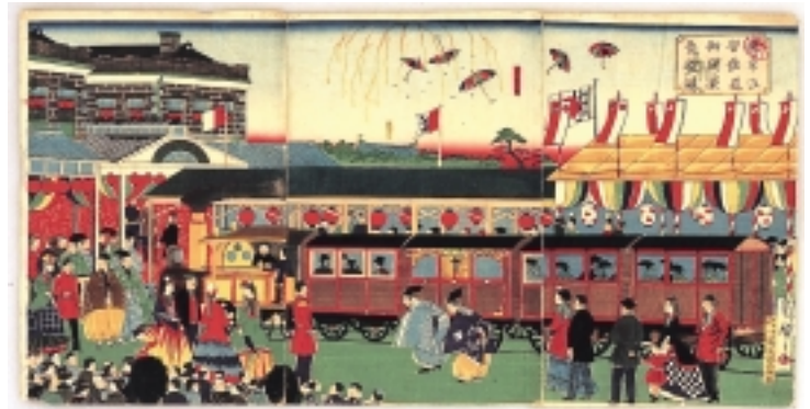
「東京汐留鉄道御開業祭礼図」