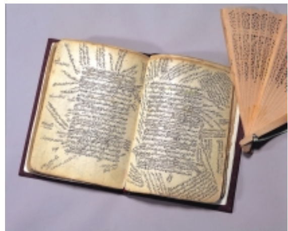
13世紀のアラビア語「哲学の導き」注解書の写本 ダイバーコレクション（東洋文化研究所）