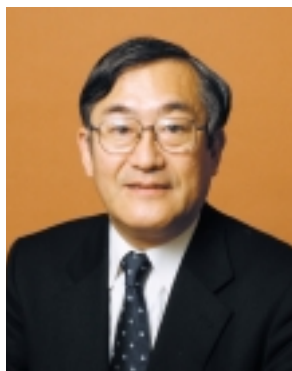
東京大学附属図書館長