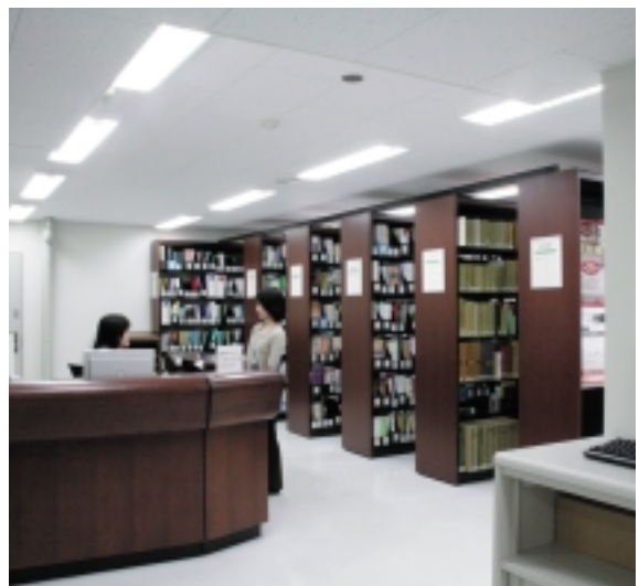
東洋文化研究所図書室