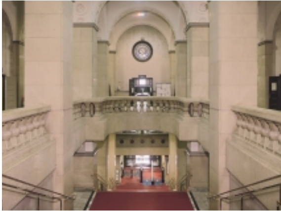
総合図書館 3階ホール