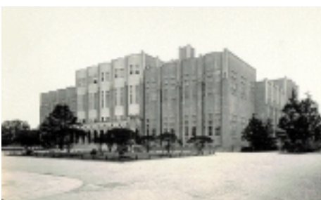
再建当時の総合図書館