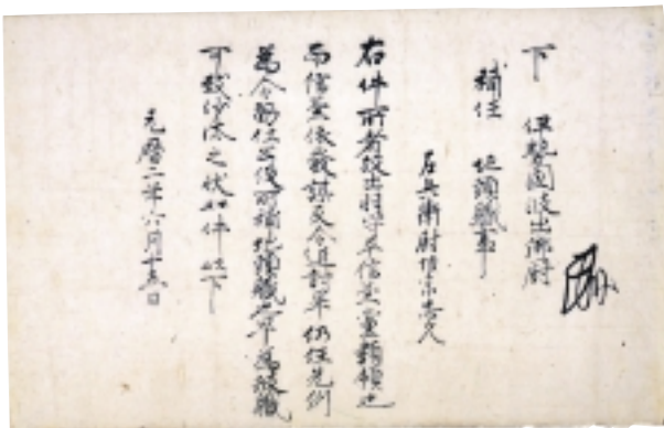
「歴代亀鑑 源頼朝下文」 島津家文書（史料編纂所）