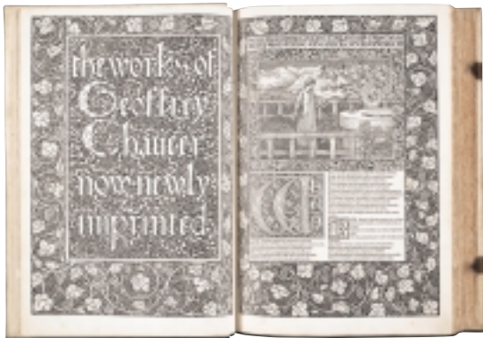
「ケルムスコット版 チョーサー著作集」 英国書史関係集書（総合図書館）