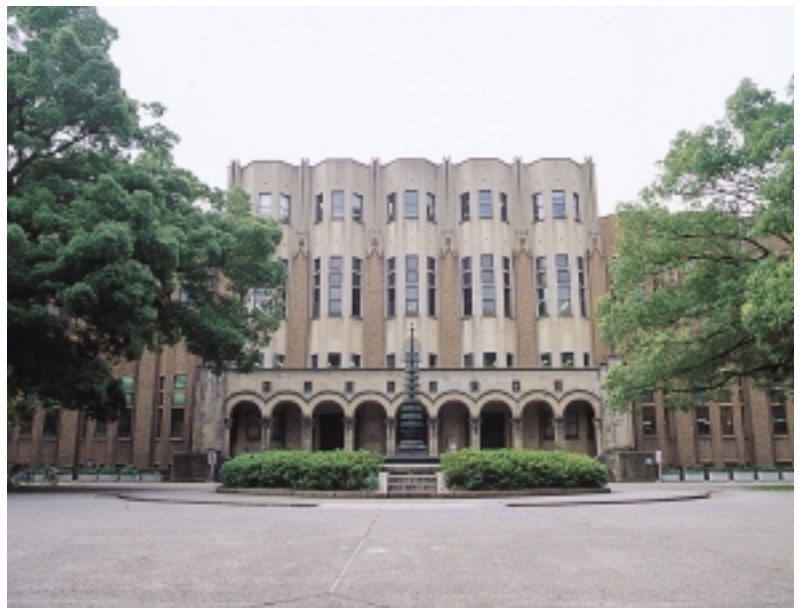
現在の総合図書館