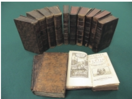
アダム・スミス文庫（経済学部図書館）