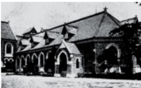
明治期の附属図書館