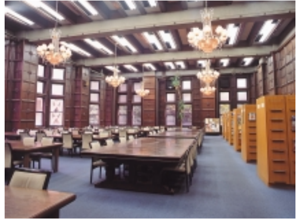
総合図書館洋雑誌閲覧室