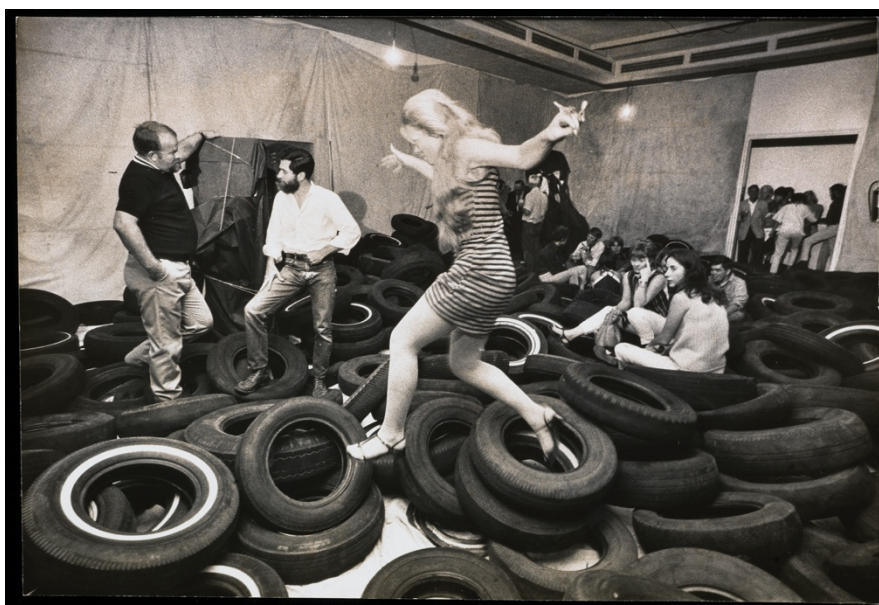
(図1) アラン・カプロー 《ヤード》 1967年