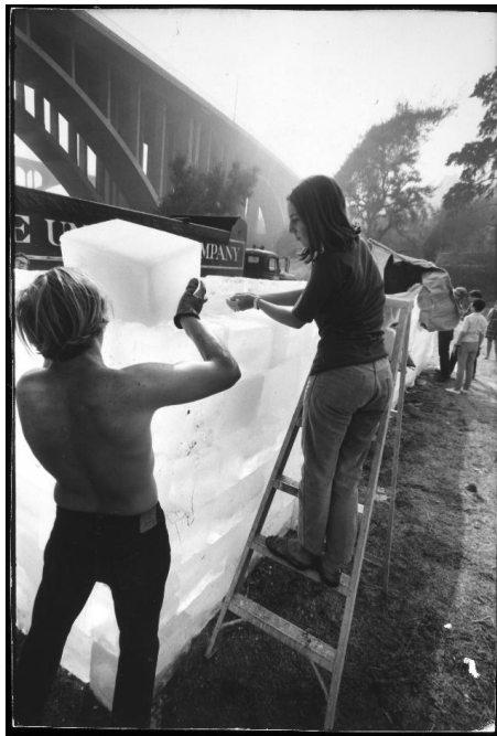
(図4) アラン・カブロー 《流体》1967年、撮影：ジュリアン・ヴァッサ