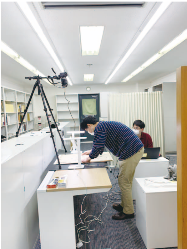
史料撮影作業の様子

なく、Web上での公開という方向を検討している。たとえば入学式・卒業式における総長式辞のような毎年更新されていくものや、東京大学全体あるいは各部局の改編などにもかかわる各種の規則だけでなく、『本編』を執筆する際に参照したさまざまな史料も当然収録されてくることになる。このうち、東大文書館が所蔵する史料については、デジタルアーカイブへのリンクを設定することで、『東京大学百五十年史』を読んで関心を持った読者をダイレクトに文書館へつないでいくことができないか、といったアイデアが出されている。『本編』は紙幅に大きく制約されるため、重要な史料であってもなかなか直接引用を大量に行うことが難しく、『資料編』へ移したとしてもその制約が存在することには変わらない。この点はデジタル上での公開とすればクリアでき、加えて文書館のデジタルアーカイブにつなぐ仕組みを作ることができれば、その原資料の閲覧や関連史料の探索へと読者を誘い、読者から利用者へと転じていく入り口になり得るのではないだろうか。かつての筆者のように、「ひとまず行ってみよう」と一歩目を踏み出す読者が現れることになれば幸いである。