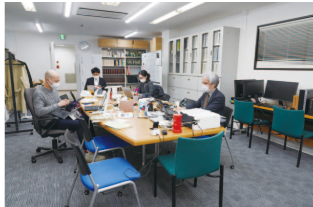
百五十年史編纂室の様子

事項だけでなく、50年前の時点では十分な論点になっていなかった事項を量的に追う基盤を作ることも目指している。これらのデータベースももちろん『資料編』として公開し、関連研究へ活用しやすい状態を整備したい。そのために、たとえば『本編』ではグラフ等で視覚的に示される数量データについて、Web上の『資料編』からは元データをダウンロードできるなど、刊行形態を活かした研究の便宜の図り方も考えたい。執筆された大学史を学術リポジトリ上で広く発信する事例は見られるが、ただ書籍を紙からWebへ移すという媒体の問題にとどめてはもったいない。デジタルゆえに、書籍という物理的な形態から解放された機能を発揮できる『資料編』となることが、多様な利用につながるだろう。逆に『本編』は、書籍ゆえに、順にページを繰っていった時に歴史叙述の醍醐味を味わえるような軸を有するものが期待されるだろう。そんな両刀を拵えることができればと夢想している。