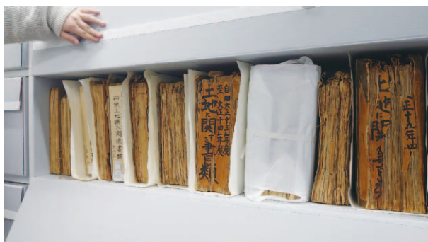
写真3：棚はめ込み式保存箱（内部）

架が進んだ書庫に対し改めて環境調査を依頼し、書架の使用率上昇による環境変化を測定する予定である。また比較的詳細な実施報告書の作成を依頼し、館員へフィードバックして専門的知見の活用に努めている。