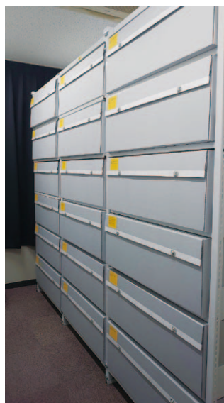
写真2：棚はめ込み式保存箱（外観）

専門的な処置や判断が必要な場合には、積極的に専門業者へ相談し、共同して処置内容を検討、実施をしている。前述の炭酸ガス燻蒸のほか、カビ損・水損資料のクリーニング・殺菌処理等は実績があり、次年度には配