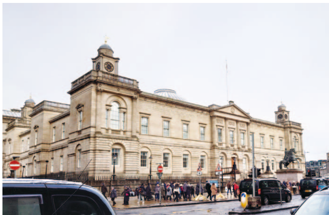
調査先のひとつ、スコットランド国立公文書館