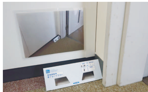
写真1：害虫トラップ設置個所の表示

粘着トラップによるモニタリングとフィードバックが基本である。書庫内複数個所で計測を行い、1か月単位で集計、発生状況や種別を特定し、発生源（内部／外部）や特性（歩行性／飛来性、食菌性、湿潤／乾燥環境志向等）を分析、対策を検討する。そのため虫の侵入・捕獲方向の把握が必要であり、清掃時のトラップ設置位置・方向変更防止のため、設置個所の壁面に指示用画像を掲示している（写真1）。また外部侵入対策に出入口床の粘着