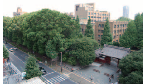
2013年現在の赤門付近