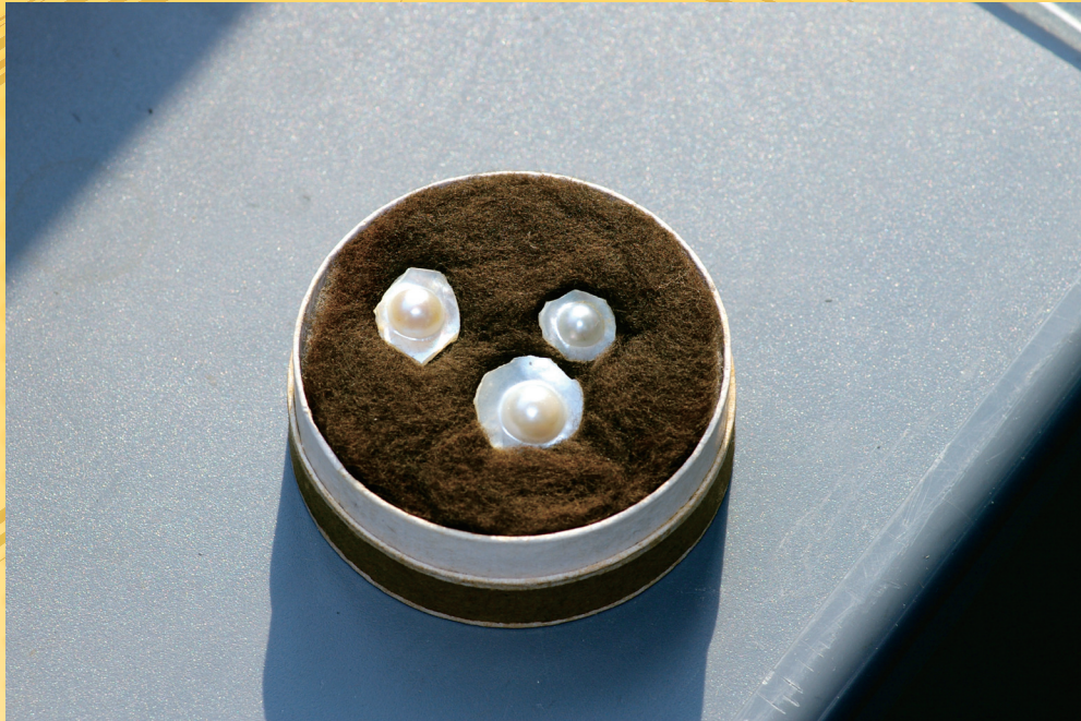
a：アコヤガイから切り出された半円真珠