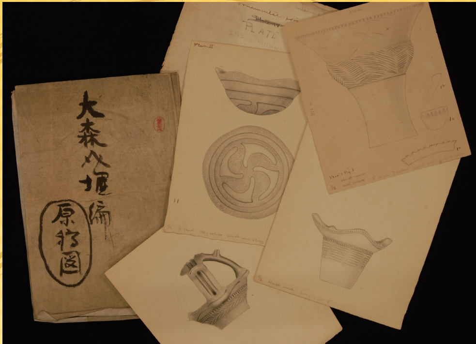
モース氏大森介墟編（原稿図）（写真：東京大学博物館人類先史部門）