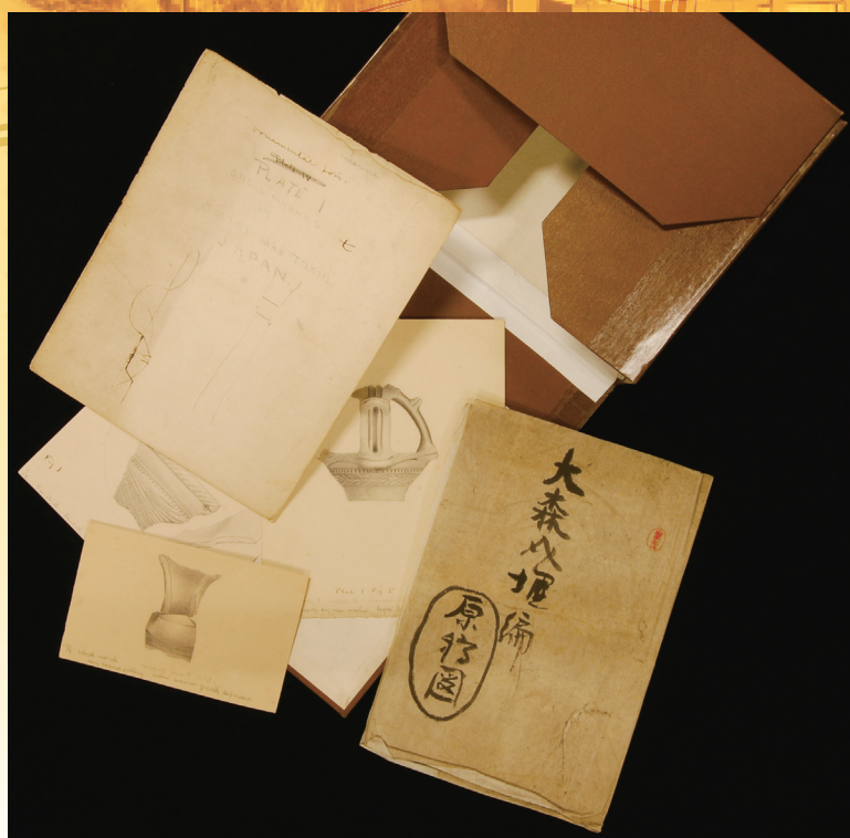
大森貝塚発掘報告書原図 ～発掘 理学の宝物「モーソの大森貝塚発掘原図」より～