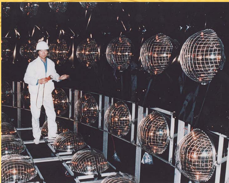
カミオカンデタンクに取り付けられた光電子増倍管