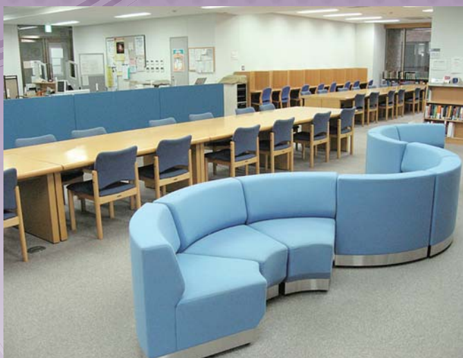
物理学教室図書館