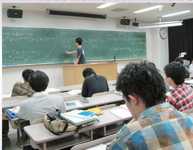
3年生物理学演習 ～専攻の魅力を語る 物理学専攻より～