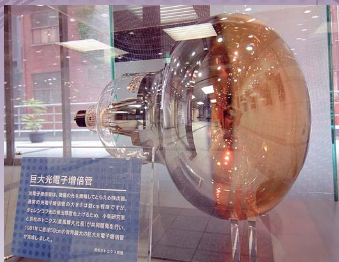
スーパーカミオカンデに使われている 巨大光電子増倍管