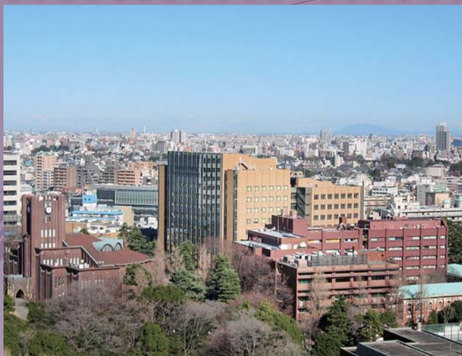
物理学専攻のある理学部1号館と4号館