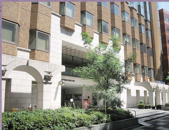
理学部1号館入り口