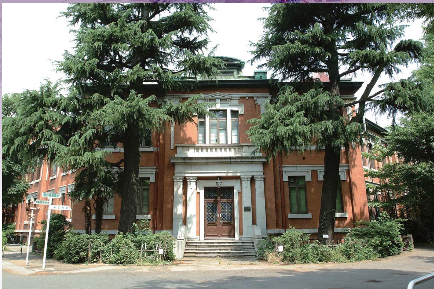
理学部化学教室の旧館（現在の化学東館）