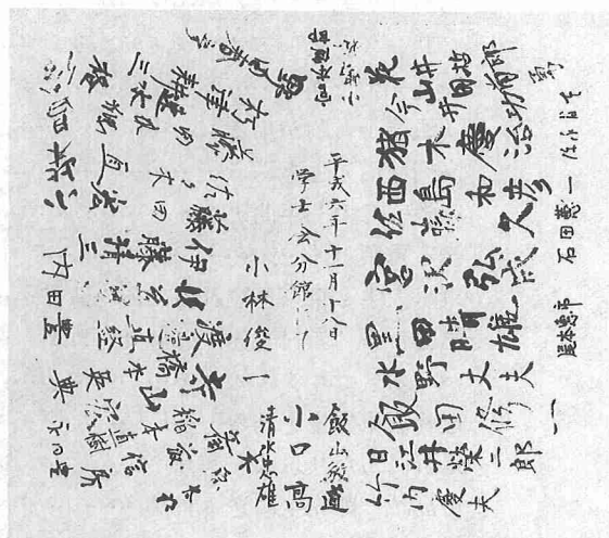
東京大学理学部名誉教授懇談会 平成6.11.18 於：学生会分館