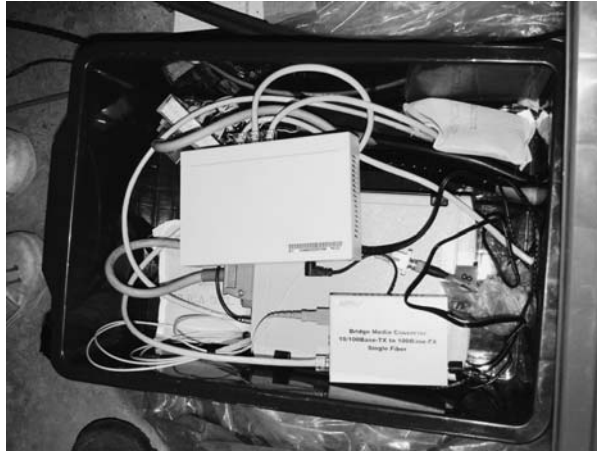
図 2. A シェルター内に設置した収納箱の様子. 3 個のユニットのうち一番底に LS-7000XT, その上に乗っている左上がハブ, そして右下の最も小型のユニットがメディアコンバータ (LTR-TX-WFC20A) である. もう 1 台の LS-7000XT は別の収納箱に入れた.