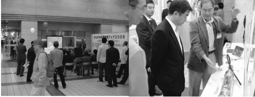
Fig. 3. Mini-presentation (left) and an explanation the exhibition of MeSO-net to the Kanagawa governor (right) at the 2008 Science forum of Kanagawa Prefecture.

部の中身はどうなっているのか?」, 「展示してある地震計測部は作動するのですか?」という共通した質問があった。