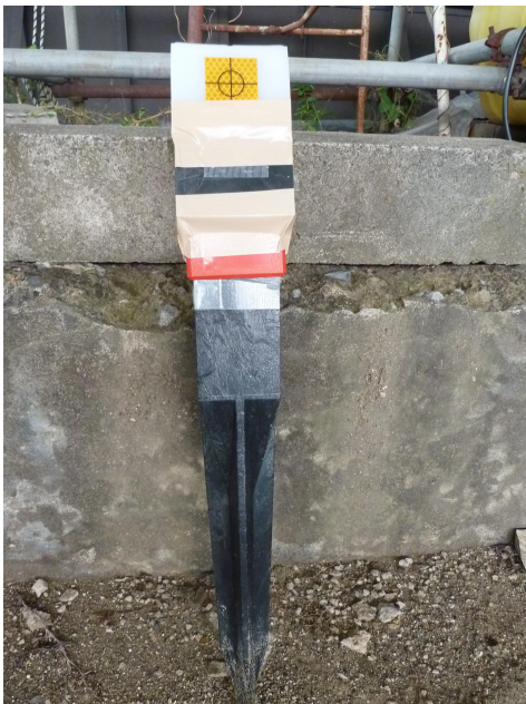
図 4.15 単独杭大型斜面実験において設置した杭