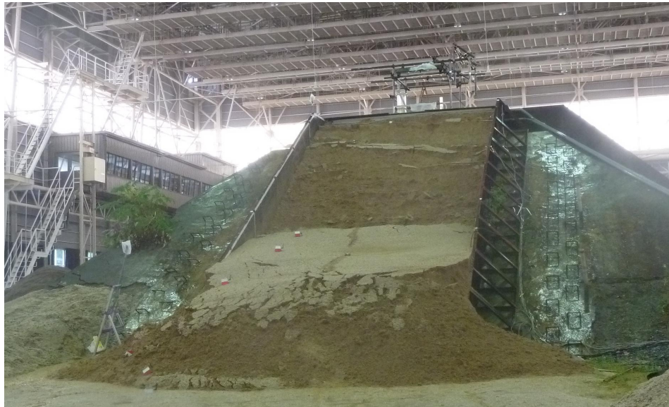
図 4.19 単独杭大型斜面実験において崩壊した斜面