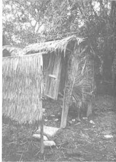
写真2 簡易水洗便所