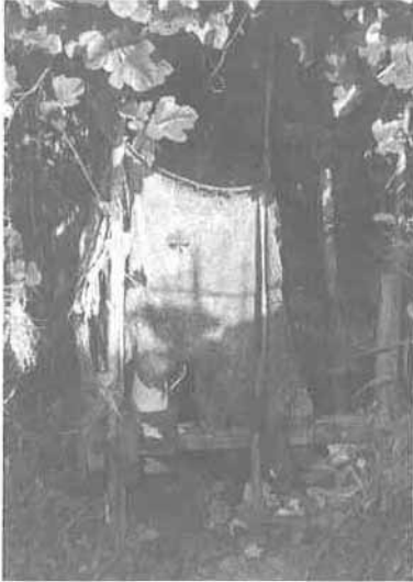
写真1 屋根付きのテレビ便所