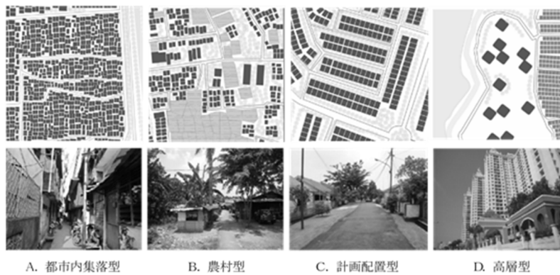
図 1. ジャカルタ都市圏における居住環境 4 類型とその分布