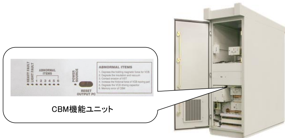
写真. CBM 機能ユニットの C-GIS 製品への適用