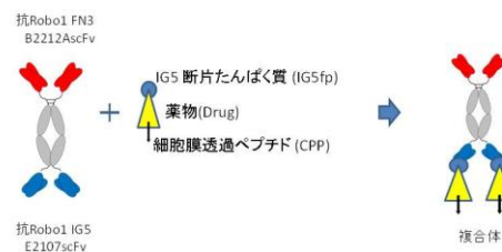
図1 二重特異性抗体を用いた抗体-薬物複合体の概略図

22F21を用いた新しい薬物送達法について述べる。抗Robo1抗体E2107はIG5ドメインをエピトープとするが、第2章で述べた手法により、細胞膜上にあるRobo1のIG5ドメイン(Robo1-IG5)とIG5断片たんぱく質(IG5fp)とを比較すると、Robo1-IG5に対する親和性が極めて高いという性質を持つことが明らかとなった。そこで、この性質を利用した薬物送達法を考案した。まず、IG5fpに薬剤(Drug)と細胞膜透過性ペプチド(CPP)を導入しIG5fp-Drug-CPPを調製する。これを22F21のIG5を認識するE2107scFv部位と反応させ複合体を形成させる(図1)。この複合体をRobo1発現細胞に反応させれば、22が細胞膜上Robo1のFN3ドメイン(Robo1-FN3)を標的として結合し(Targeting, T)、続いてIG5fpとRobo1-IG5との交換反応によりIG5fp-Drug-CPPが放出され(Releasing, R)、CPPの性質によりIG5fp-Drug-CPPが細胞内に取り込まれ(Penetrating, P)、薬剤の効果が発揮される(図2)。