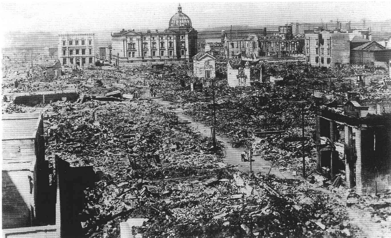
写真 1 大正関東地震による横浜市の被災状況

による建物被害や土砂災害、さらに津波とその後に発生した大規模な延焼火災によって、今、私達の住んでいる関東地方全域と静岡・山梨両県に大災害をもたらした。死者・行方不明者は 10 万 5 千人、焼失家屋数 44.7 万戸、全半潰建物 25.4 万棟にのぼった。焼失したり、全半潰した建物の数は、当時の建物ストック全体に対して、東京で 7 割、横浜で 6 割を占め（写真 1）、被害総額の 55～65 億円は当時の GDP の 4 割を越えた。表 1 に過去の有名な自然災害と比較したデータを示すが、大正関東地震の影響がいかに