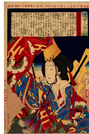
小野秀雄コレクション「近世人物誌やまと新聞付録の項番:123 資料No.6」