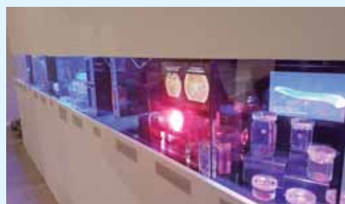
上：三崎臨海実験所に新設された教育棟完成披露式典におけるテープカットの様子（展示室「海のショーケース」入口前） 下：教育棟内に完成した展示室「海のショーケース」の様子